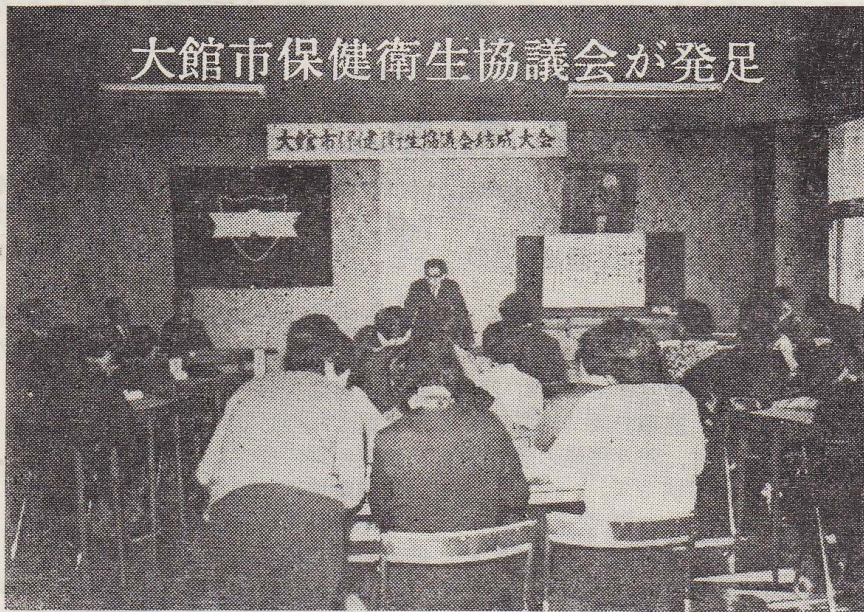
大館市保健衛生協議会結成大会

去る2月26日、市の連合婦人会が主体となつて、大館市保健衛生協議会を結成するための大会を開きました。