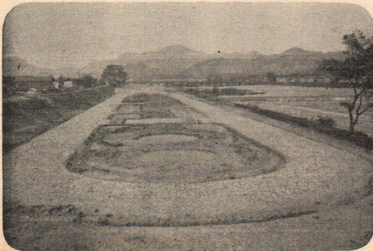
(写真) 大橋から見た交通公園

交通戦争ともいわれる昨今、子どもさんたちに遊びながら交通規則を身につけさせ、楽しい日々を送っていただくこと、昨年から着手した交通公園は写真のようにほぼ、その形態ができあがりました。