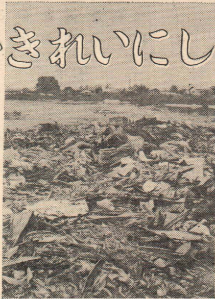
(長木川原のごみの山)

空地もゴミ箱化している所があります。ゴミの定時収集をしているにもかかわらず、ある町内の空地も、ゴミの山になり、カヤハエの天国となっていた。