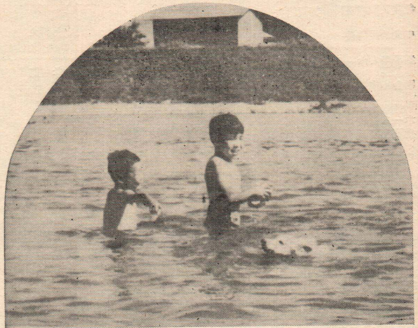
ワンチャンも水およぎ（長木川で）

この夏こそは、大人も子どもも楽しく過すため、子どもの水泳については十分気を配って欲しいものです。