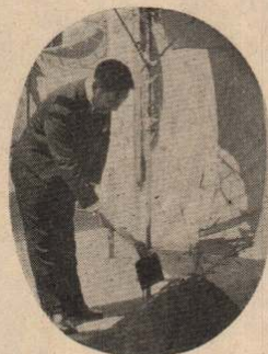
(写真) 起工式でくわ入れをする市長

らい年の12月には、県北一の公的病院として、高度の医療設備をもった近代建築に生れ変わるわけで、利用者の皆さんには安心して通院、入院していただけるものと思ひ、皆さんとともに病院の完成を期待したい。