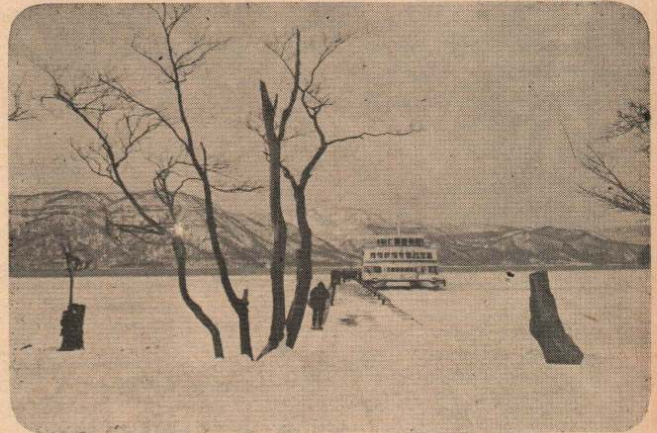
(写真) 3月上旬の十和田湖

一方, 十和田観光客の素通りで, とかく問題のあった本市の観光事業も, ことしは, 黒鉾コースなどを含めた16カ所のハイキングコースの設定, 昨年につづく「大文字焼」の実施, さらに既存の大滝, 日景, 矢立, 雪沢の温泉郷や矢立峠, 長走風穴の景勝地のPRにつとめ, 十和田, 八幡平の玄関口にふさわしい観光地に育てあげることしております。