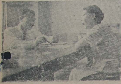
真剣な借地借家の相談