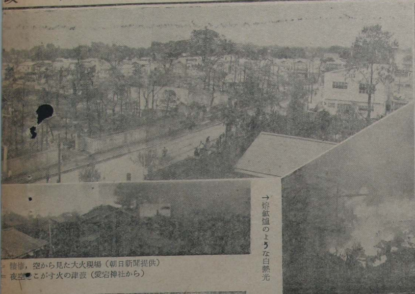
→ 燈籠のようにならぬ 惨憺、空から見た大火現場 夜空こそが火の津波(愛宕神社から)