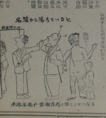
未成年者中葉者産科と同じことになり