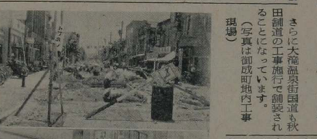
市内の国道は最近非常な傷み...