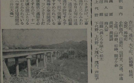
二井田大橋の架橋工事が進行中である。

二井田 月末には完成 上旬から通勤も可能 一昨年十月の豪雨出水により、欠陥流した二井田大橋の架橋工事は三十二、三三メートル、五メートル、下部工はコンクリートパイプ打込み、上部工はコンクリート打込み、排水設備の完成、工事費は約三千三百万円を要して、本月末までに完成の見込みである。現在池内二井田間の交通には、旧二井田方面から大館市街に通ずる最短経路が、二井田池内間の木代川に架