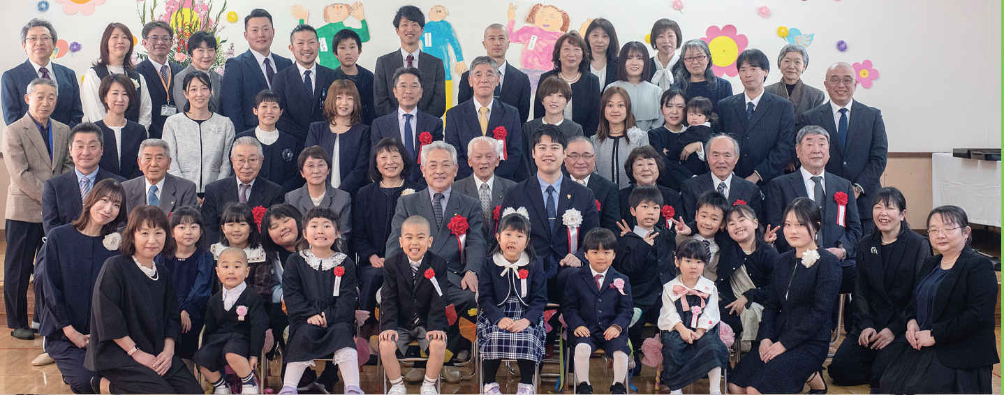
大館市下川沿保育所 閉所式