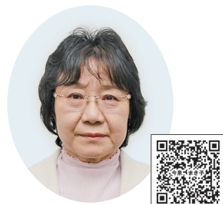
いまいずみ まきこ 今泉 まき子 (日本共産党)