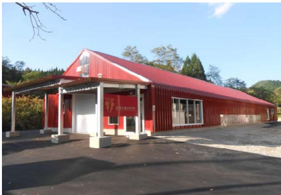
小坂七滝ワイナリー