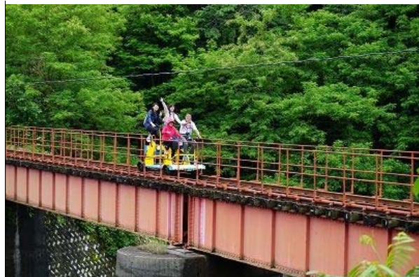
大館・小坂鉄道レールバイク