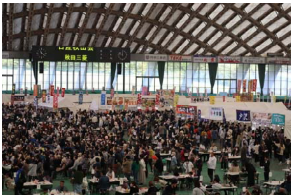
本場大館きりたんぼまつり