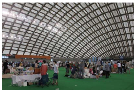
大館エコフェア（ニプロハチ公ドーム）