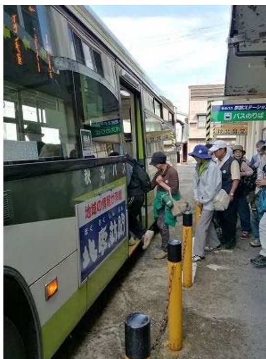
住民の足として欠かせない公共交通（秋北バス）