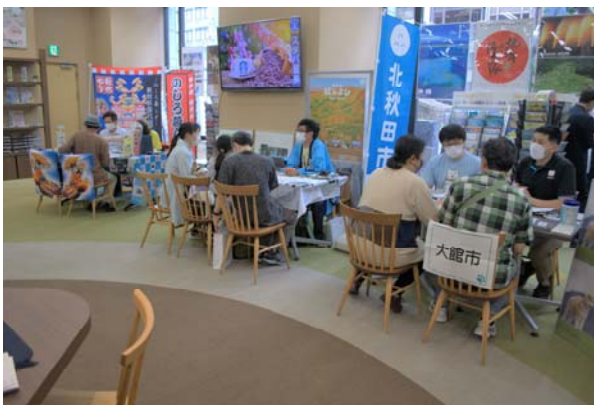
首都圏での移住相談会