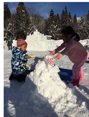
冬の生活体験ツアー