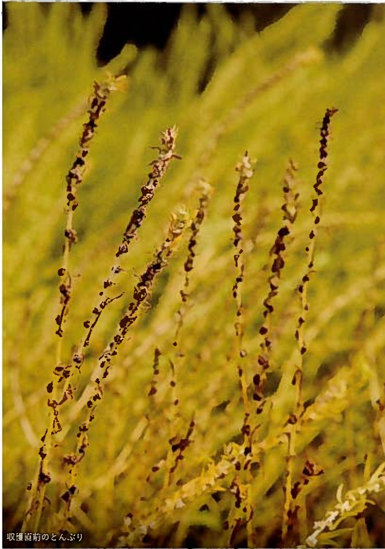
収穫直前のとんぶり