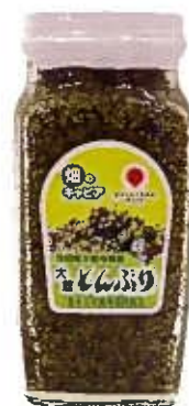
製品名：瓶詰め(大) 内容量：300g 保存方法：常温20℃以下 保存期間：6ヶ月 製造期間：10月-7月(作柄による)

JAあきた北では、用途に合わせバラエティに富んだ商品ラインアップを用意しています。地元で旬の時期にしか味わえない「生とんぶり」は特にオススメです。他にも保存に適した真空パックや冷凍などの業務用から、お土産に適した瓶詰めなどがあります。いずれも販売期間が限られていますので、各店舗にご確認ください。