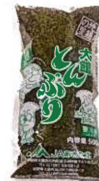
製品名：生・冷凍(業務用) 内容量：500g 保存方法(期間)：生・冷蔵(2週間) 保存方法(期間)：冷凍(6ヶ月) 製造期間：10月-7月(作柄による)