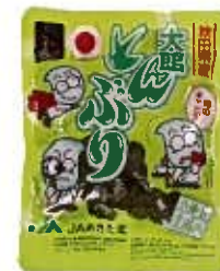
製品名：真空パック 内容量：70g 保存方法：常温20℃以下 保存期間：2ヶ月 製造期間：10月-7月(作柄による)