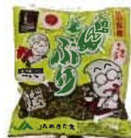
製品名：生とんぶり 内容量：70g 保存方法：冷蔵 保存期間：2週間 製造期間：10月-3月