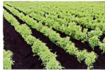
通路の除草と倒伏防止の土寄せ