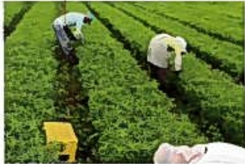
苗床より苗を選別