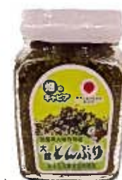
製品名：瓶詰め(小) 内容量：170g 保存方法：常温20℃以下 保存期間：6ヶ月 製造期間：10月-7月(作柄による)