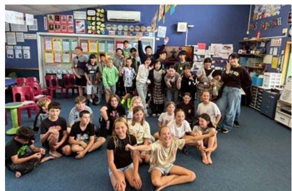
ハウタップスクール