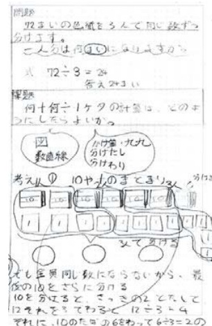
【考えの跡が分かるノート作り】