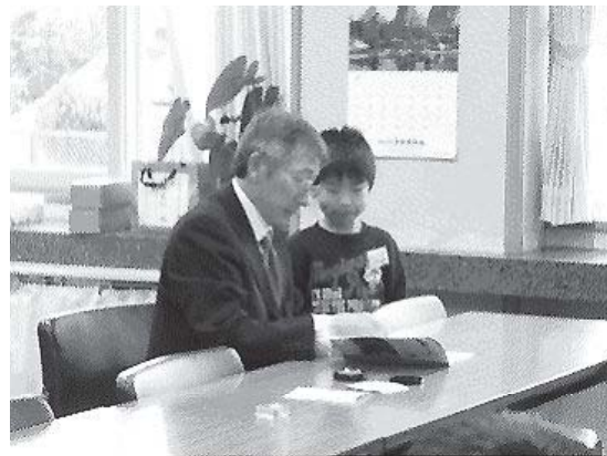
【花丸DAYに校長先生から花丸をいた】