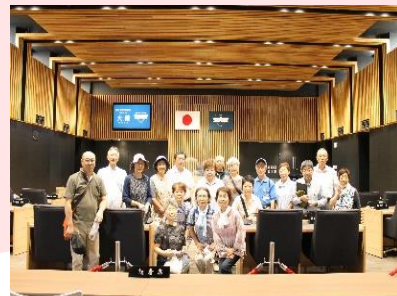
市議会議場にて記念撮影

このほか昨年7月に大館城のあった桂城公園を散策したときは、まだ建設工事中であった市役所新庁舎が5月に利用開始したことで、庁舎見学を兼ねて訪問。議会議場のある5階展望ロビーからは公園内や市街地を一望し歴史に想いを馳せた一行でした。