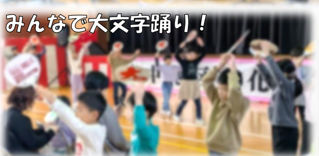
みんなで大文字踊り！