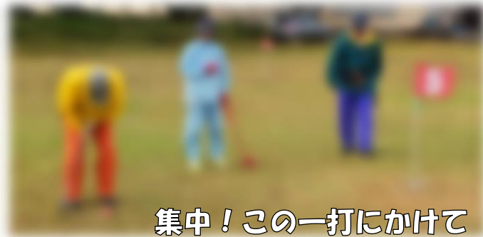
集中！この一打にかけて