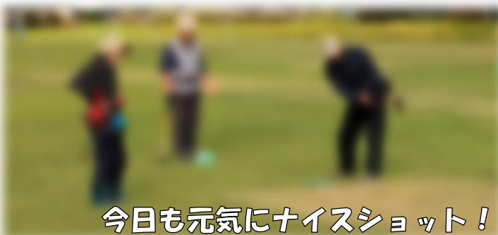
今日も元気にナイスショット！

10月8日(水)、第17回全公民館グラウンド・ゴルフ大会が開催されました。朝は雨と冷え込みがありましたが、9時の競技開始時には晴れ、参加者52名の熱気に包まれ、会場は活気にあふれました。大会は大館GG協会と真中GGサークルの協力で整備されたコースで行われ、皆さんは日頃の練習の成果を発揮し、ナイスショットを喜び合いながら交流を深めました。