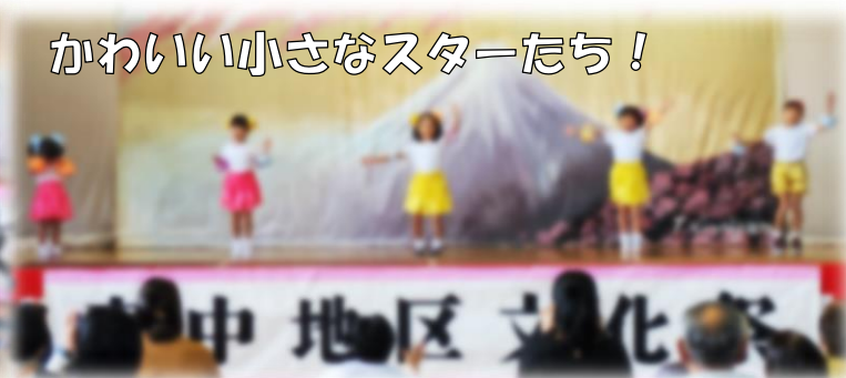
かわいい小さなスターたち！