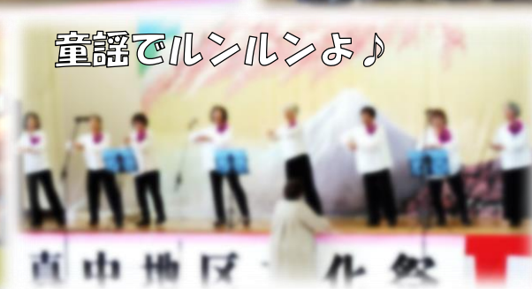
童謡でリンリンよ♪