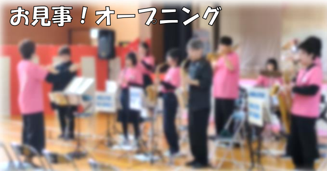
お見事！オーフニング