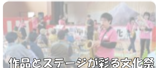
作品とステージが彩る文化祭

150名を超える来場者があり、作品展示やステージ発表を通して日頃の活動の成果が披露されました。