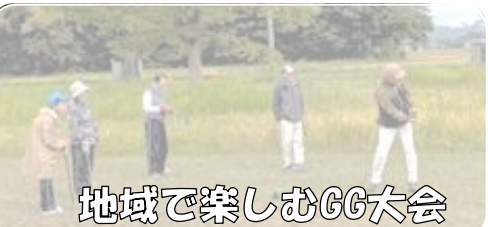
地域で楽しむGG大会