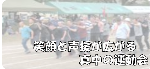
笑顔と声援が広がる 真中の運動会