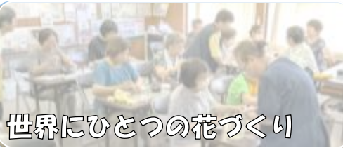
世界にひとつの花づくり