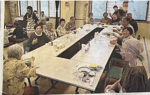
食事やゲームをしながら交流する住民(二井田公民館)