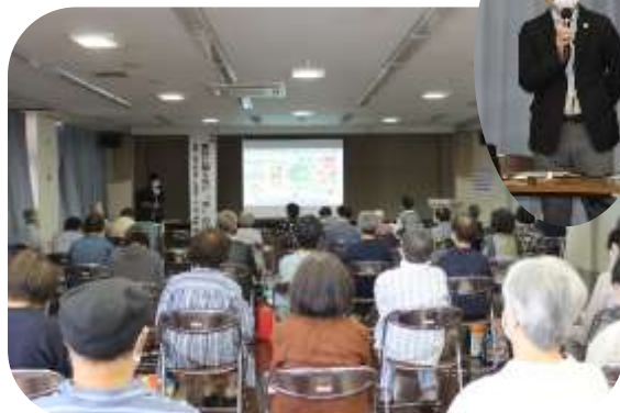
受講生 41 人が市出前講座を聴講する様子