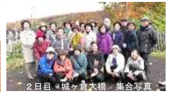
2日目 城ヶ倉大橋 集合写真