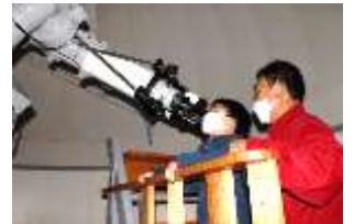
天文台にて土星観察