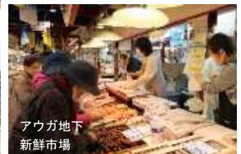
アウガ地下新鮮市場