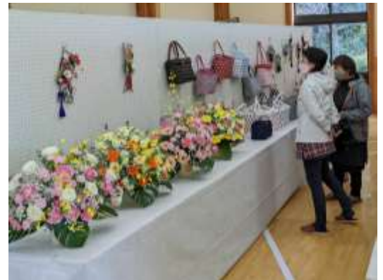
作品に見入る来館者