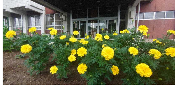
田代公民館の花壇マリーゴールド

今年も24の個人と団体の方々がこの活動に参加してくれました。花いっぱいの明るい地域づくりにご協力ありがとうございます。