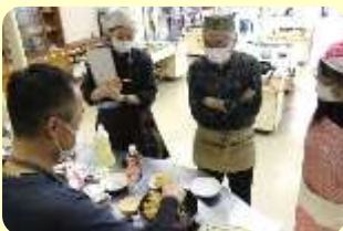
かんたんチャーハンとたまごスープ