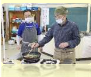
でっかいハンバーグとナムル

初回は「でっかいハンバーグとナムル」に挑戦。ナムルはフライパンでニンジン、小松菜、もやしの順で茹で鶏がらスープの素やごま油で味付け、でっかいハンバーグはひき肉にたまご、調味料を入れ冷凍パンをすりおろし器で細かくして混ぜ合わせ直径20cmほどにし両面を焼いて完成、サキホコシ、なめこの味噌汁と一緒に試食した。