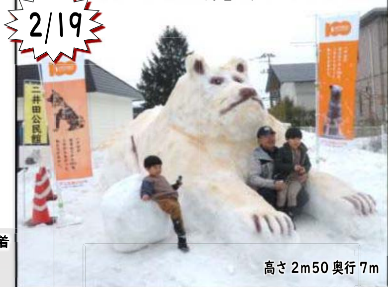
高さ 2m50 奥行 7m

突風や雨、吹雪めまぐるしい天候に左右されながらも、1 週間かけて完成しました。 来年は分団対抗雪像まつりになるかも？