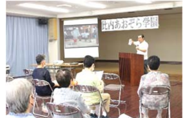
7月20日、23人の受講生が聴講

祭りの模様を映像で紹介し、大雨の中で「湯釜行事が初めて取り止め」となったこと、記念として「祭祀舞の復活」「特別拝観の実施」などを話し、往古の人々が残してくれた「文化遺産」を大切にすることをお願いしながら、天災などで避難する際には古くから見守ってくれている祠などを思い出して安全地帯を確認することを推奨して終わりました。ご清聴、感謝申し上げます。