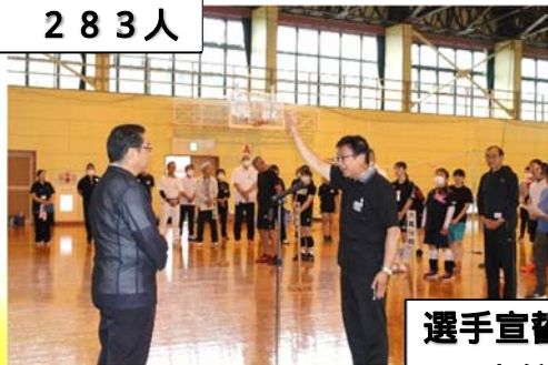
選手宣誓 東館分館