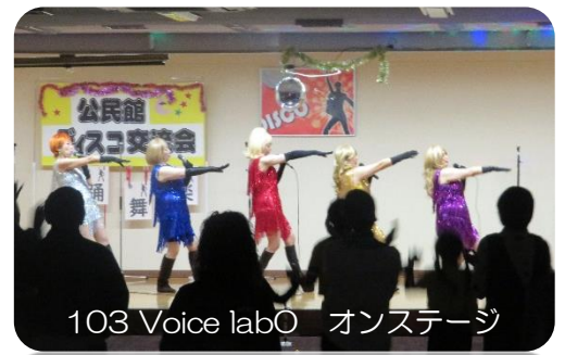
103 Voice labO オンステージ

3月9日(土)比内公民館でステージのある第9研修室を会場に公民館ディスコを開催しました。市公民館連合企画として二井田・真中・下川沿・矢立・花岡・比内の計6館の職員が運営に務めました。参加者は市内中高年中心に、少年スポーツチームも合流し、約60名の参加がありました。大画面に映る映像や音楽に合わせ、思い思いに体を揺らし懐かしいディスコ音楽を楽しみました。休憩タイムには、防災コーナーを出店し、公民館備蓄アルファ米の試食。家庭でも取り組んでほしい、「ローリングストック」を推奨。各テーブルでは公民館地域を超えた交流の機会となりました。フィナーレは、キレキレさがピカイチだったというディスコキング&クイーンとともに「YMCA」の曲で打ち上げました。