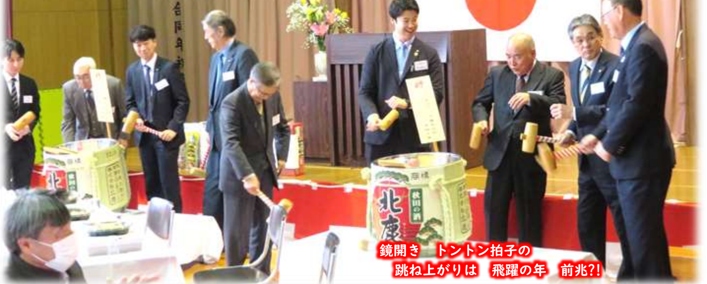
鏡開き トントン拍子の 跳ね上がりは 飛躍の年 前兆?!

雪の多かった正月でしたが、新年会は晴れ上がり、安心しての新年交流。市長、市議ほか来賓、町内からの参加者70名。年1回の貴重な交流機会となりました。いい年になりますように。