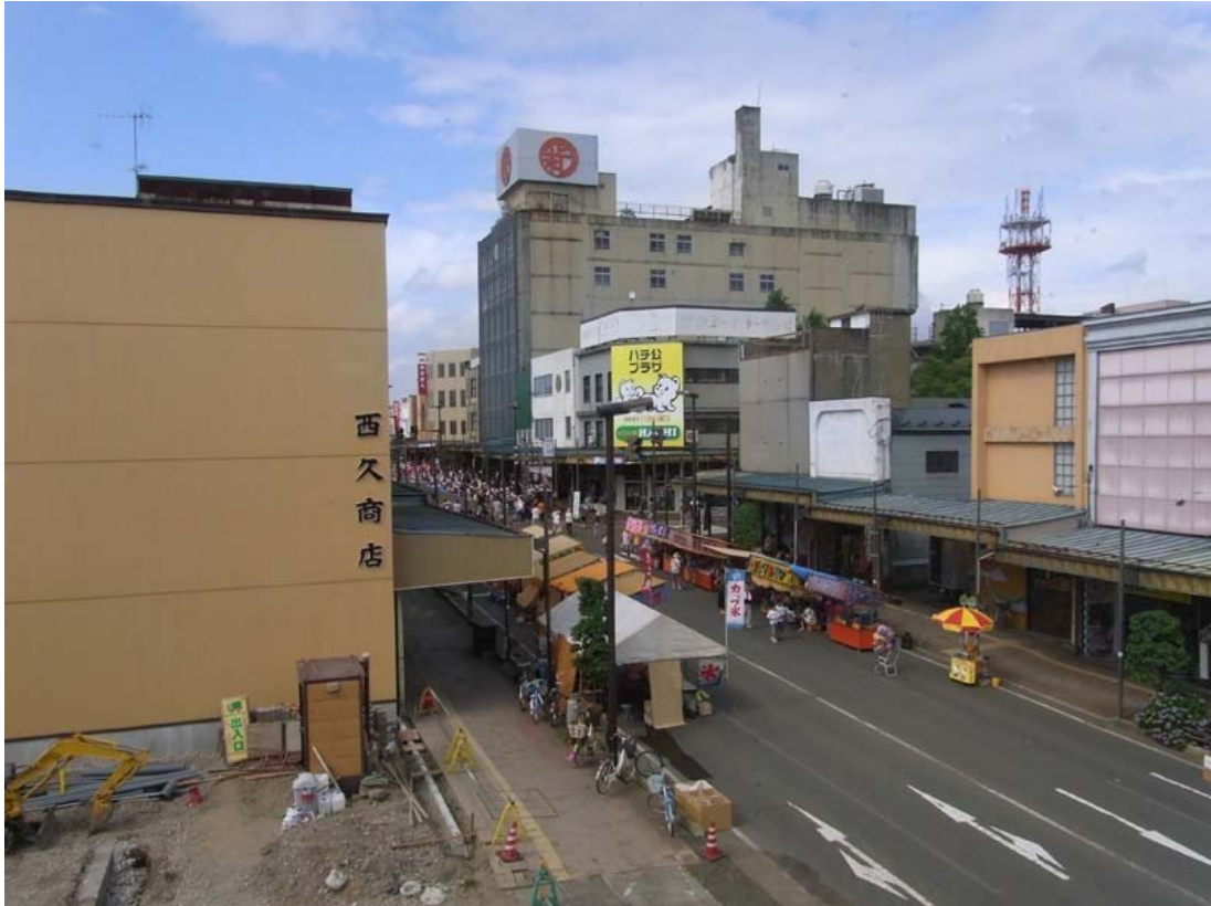
東棟 3 F バルコニーより