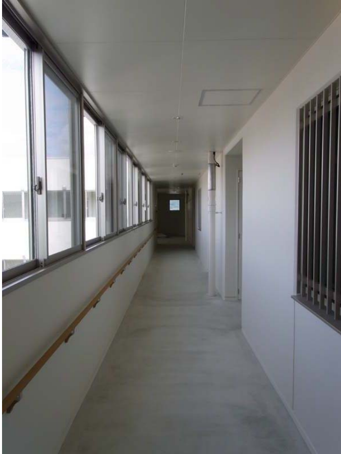
南棟廊下 ( 6 F )