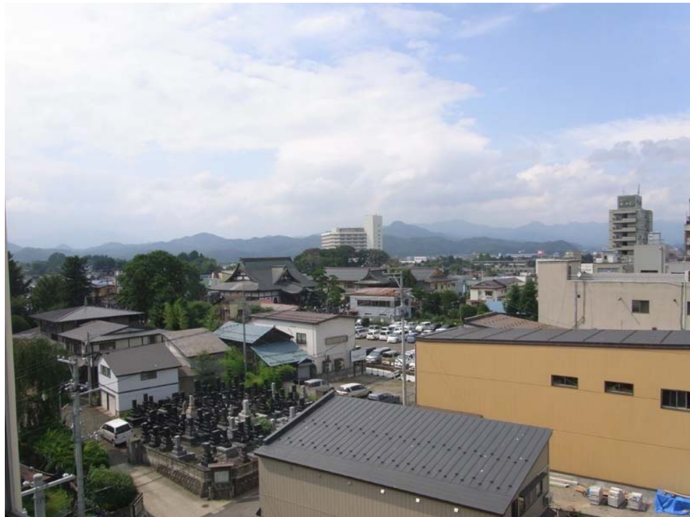
東棟眺望 ( 6 F )