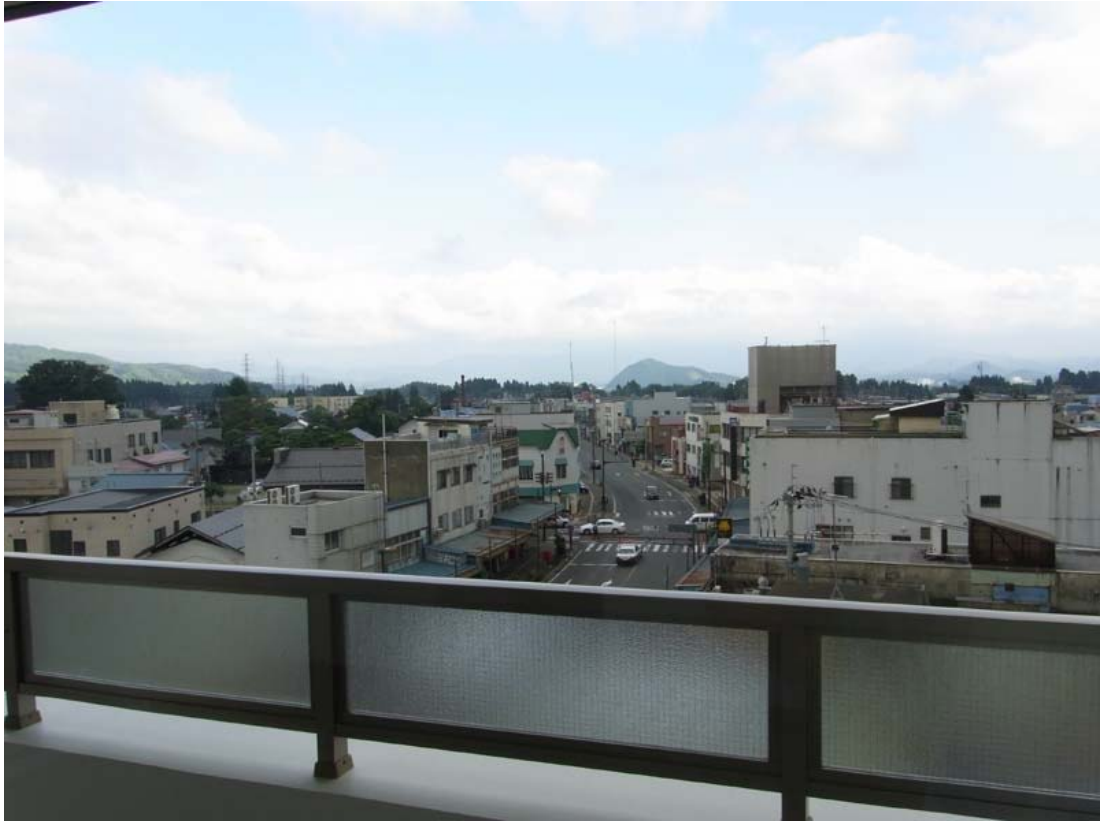
南棟 6 F バルコニーより