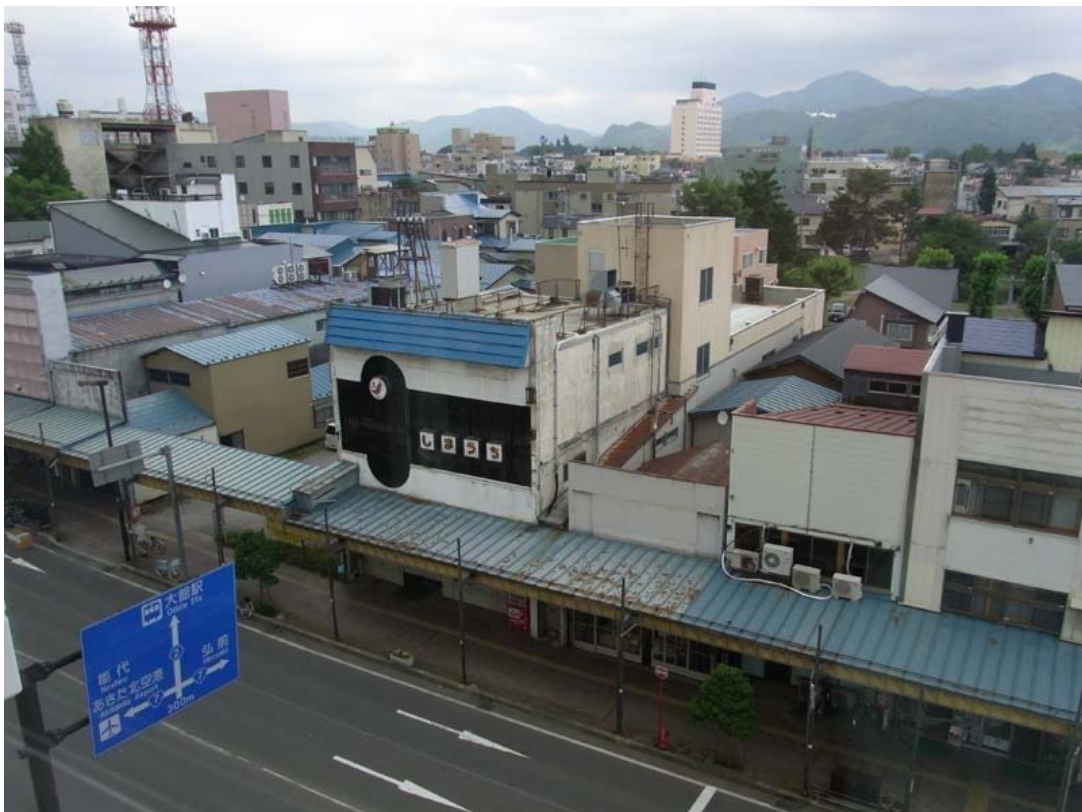
東棟 6 F より