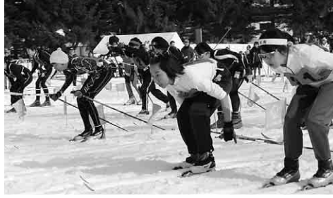
各学校とも力が入るリレー競技がスタート!