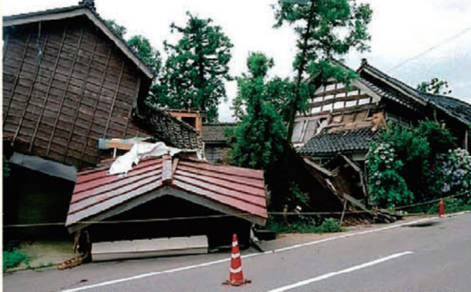
木造建物被害の例（平成19年7月新潟県中越沖地震）