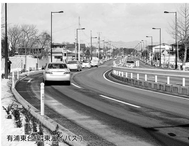
有浦東台線(東八バイパス)

認可区域の84.4%に当たる1119.4haが整備され、4月から大館地域では東台、鉄砲場、清水、中道の一部、比内地域では下味噌内の一部、田代地域では赤川の一部など、合わせて約46haを新たに供用開始します。