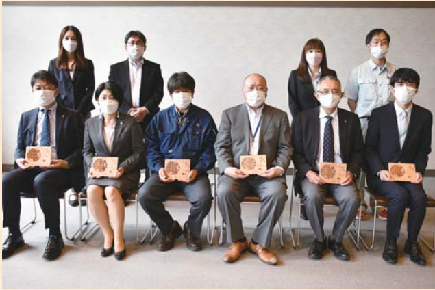
▲今年度プレミアム認定を受けた事業所の皆さん