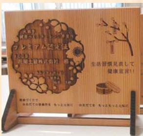
◀プレミアム認定された事業所に交付される秋田杉製の「プレミアム認定証」

今年度は、新しく9事業所が参加し、計27事業所が認定を受けました。このうち、3年間継続して取り組みを行った6事業所については「プレミアム認定」となり、市内事業所における健康経営への関心の高まりが感じられました。