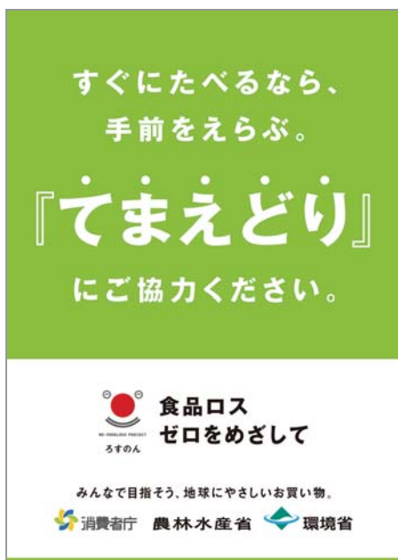
▲「てまえどり」啓発ポスター

新型コロナウイルスやウクライナ情勢などによるエネルギー・食料品等の価格高騰に伴う家計への影響から、皆さんも普段の買い物など「消費」への関心が高まっているのではないのでしょうか。