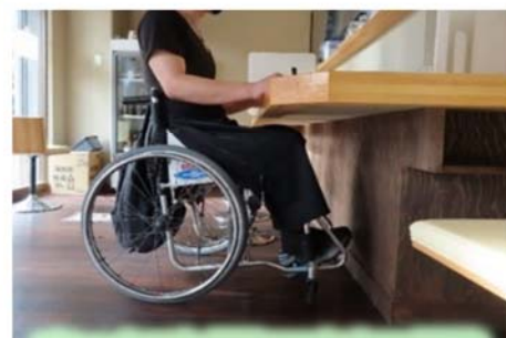
車いすでも使える客席の整備