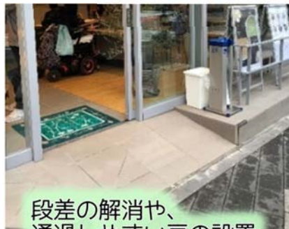
段差の解消や、 通過しやすい戸の設置