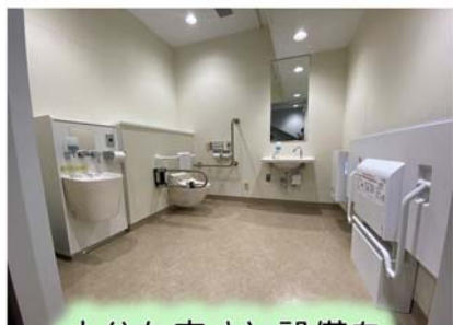
十分な広さと設備を 確保したトイレ