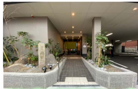
出入口前の手すり付きスロープ