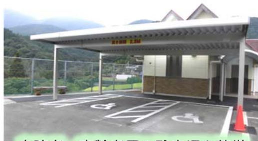
身障者・高齢者用の駐車場を整備