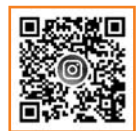
ホストタウン大館 Instagram