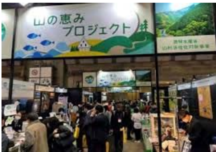
昨年度の山の恵みプロジェクトブースの様子

国内最大級の見本市に 農水省山村活性化支援事業「山の恵みプロジェクト」の合同ブース内で出展