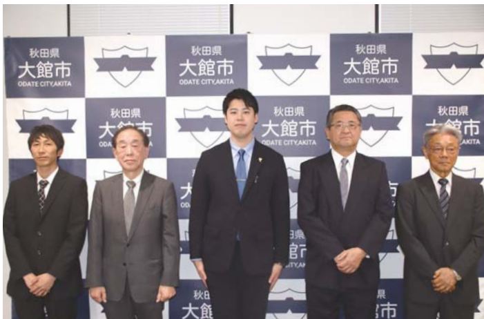
▲ 4団体を設置団体として選定しました。

今後は、アンケート調査による地域課題の掘り起こしや分析をもとに、地域の維持・活性化について話し合い、地域と行政や関係機関との連絡調整を行いながら、課題を解決するための具体的な方策を検討し、実施していくこととなります。