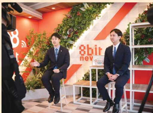
▲ハチスタで行った地域活性化起業者人委嘱式

ハチスタを北東北の魅力発信の新拠点として、市民、地元企業、行政が共に発信・行動し、「子や孫世代と共に栄える大館」を形にしていきたいと思います。