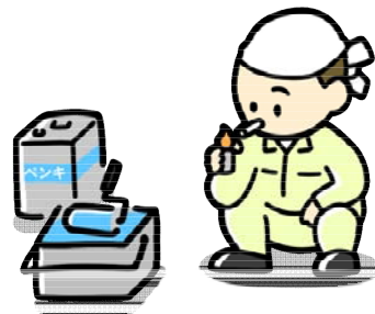
使用中は火気厳禁

ガソリン購入の際に身分証の確認を求められたり、使用目的について聞かれたりする場合があります