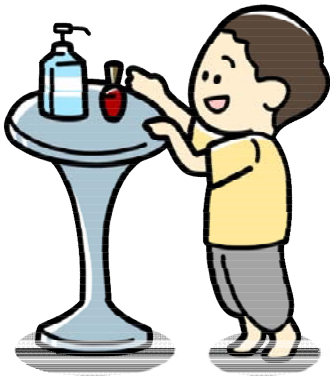
子供の手の届くところに置かない

ガソリンや灯油などは、事業所や一般家庭で幅広く利用され、私たちの日常生活に不可欠なものですが、誤った使用方法により大きな事故を招くこともありますので、危険性を認識した上で、安全に取り扱いましょう。