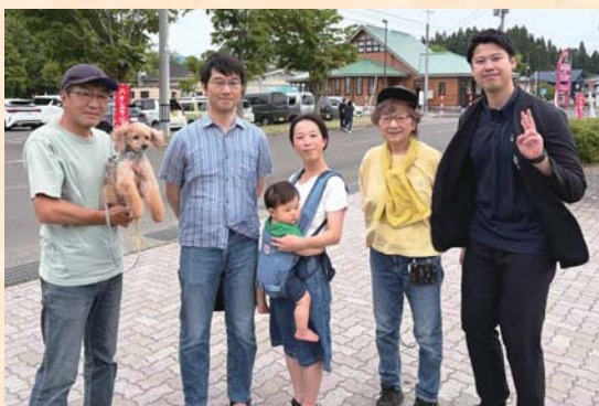
▲大館に移住したご家族(写真中央)と大館に暮らすご両親と一緒に

新しい挑戦や人の流れも少しずつ生まれ始めていますが、その歩みはまだ道半ばです。そのため現在、地域おこし協力隊制度を活用し、新しい仕事づくりと事業承継を同時に進める大館ベンチャーラボ・レガシーラボ事業を進めています。大好きな大館で「自分のやりたいことができる」「家族や面白い仲間がいて、地域が応援してくれる」、そんな大館を目指し、これからも移住・定住、そして新しい人生の選択につながる政策を進めてまいります。