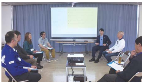
▲前回(比内地域)の対話の様子